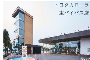
トヨタカローラ 東バイパス店