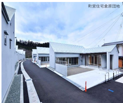
町営住宅倉原団地