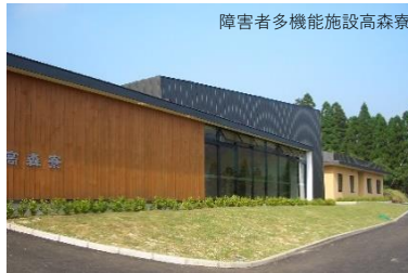
障害者多機能施設高森寮

設計力、デザイン力に秀でた方（DRA - CAD、Jw_cad、Vectorworks、Illustrator、Photoshopスキルのある方歓迎） コミュニケーション能力に秀でた方