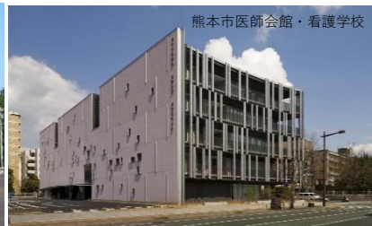
熊本市医師会館・看護学校